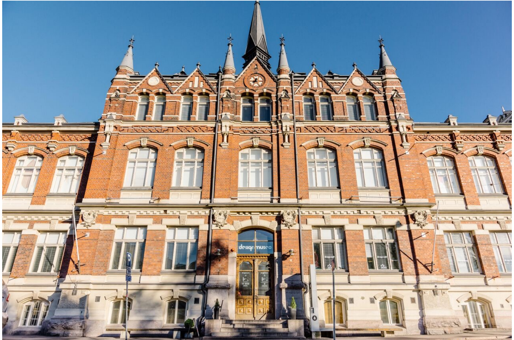
Designmuseo | Designmuseet | Design Museum Helsinki