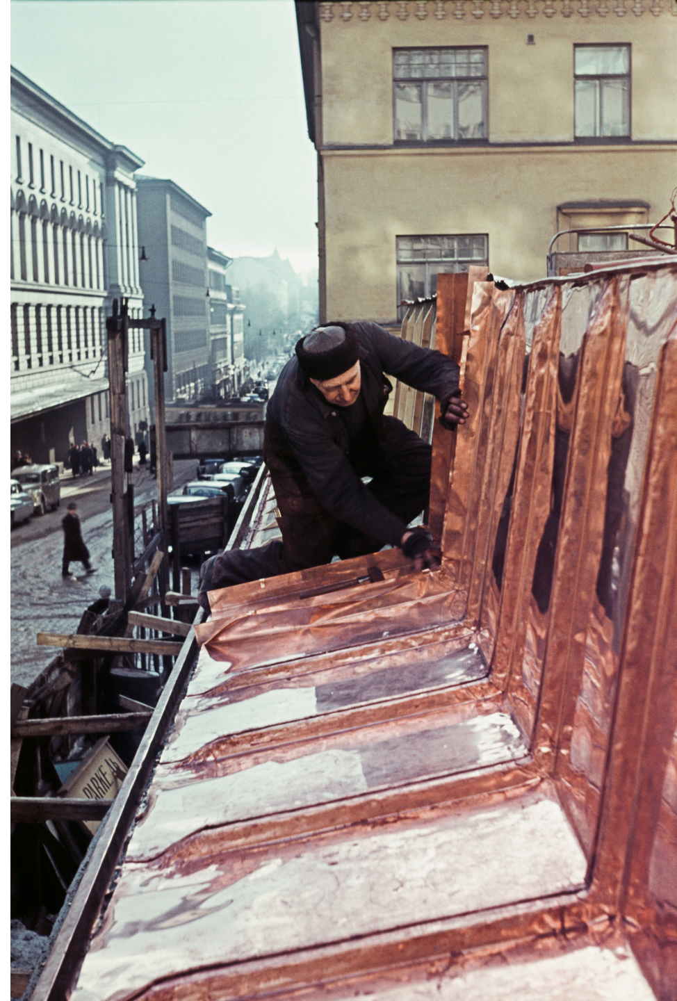
Peltiseppä työstä Porthanias kattoa. Plåtslagaren arbetar med Porthanias tak. The metal craftsman is working on Porthania's roof.