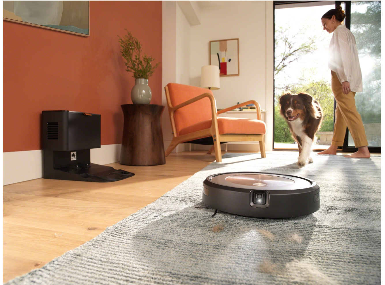
Roomba J9 -robotti-imuri. Robotdammsugaren Roomba J9. Englanniksi: The Roomba J9 robot vacuum cleaner.