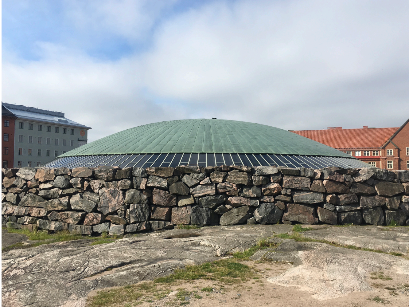
Timo ja Tuomo Suomalainen: Tempeli aukion kirkko, 1969. Timo och Tuomo Suomalainen: Tempeli aukion kyrka, 1969. Timo and Tuomo Suomalainen: Tempeli aukio Church, 1969.