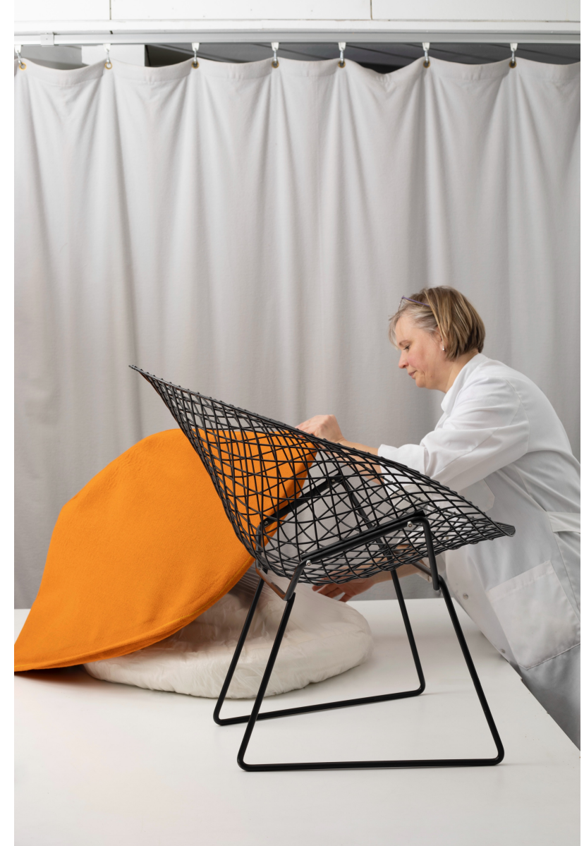
Conservation of the Diamond chair in the collection of the Museum of Finnish Architecture and the Design Museum Helsinki. Chairs designed by Harry Bertoia for Knoll were manufactured under license in Finland from the 1950s. The Diamond chair with a metal frame was conserved by Henna Koskinen in 2023.